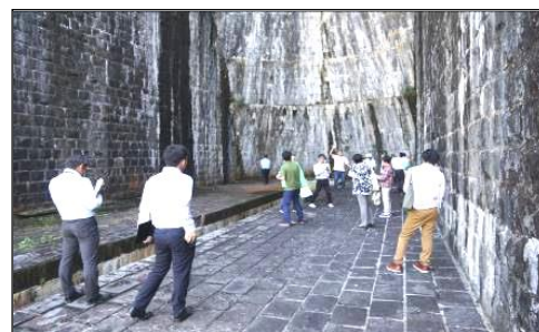
<豊稔池アーチ直下で偉容に圧倒されました>