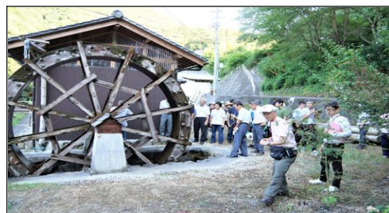
<地域づくりのシンボルに感動を抱く>