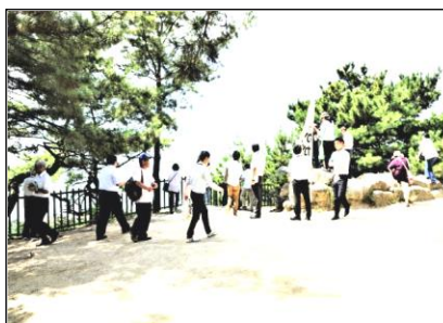
<琴弾山頂で砂絵にカメラを向けました>

琴弾公園、豊稔池ダム、五郷水車、雲辺寺などを訪れ、県外からの参加者に地域の資源を感得してもらいました。