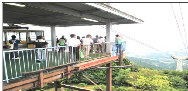
<ロープウェイ山頂駅からの眺望に見とれました>