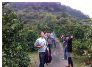
おいしいみかんに思わず笑顔がこぼれます。