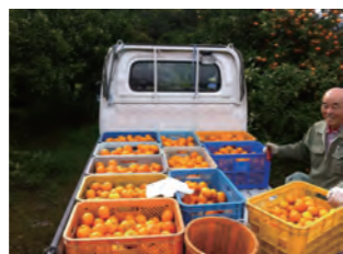
たくさん収穫しましたよ！