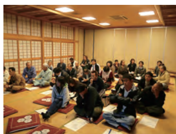
今五郷でできることについて考え中

11 月 17 日 (木)、活性化センターで『五郷里づくり運動』の集まりが行われました。ほんの 1 部ですが、ご紹介します！